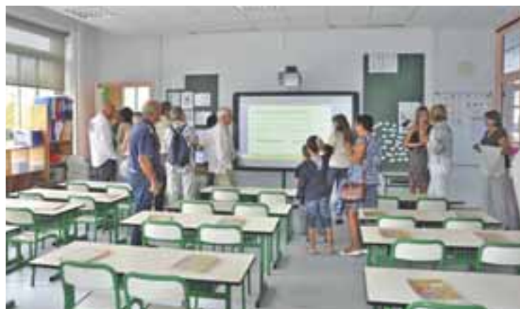
Rénovation des écoles publiques : visite des locaux du 3 septembre, en présence des représentants de l'Education Nationale et des parents d'élèves