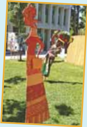
Figurines réalisées par les écoles de Chambéry.

Placé sous le haut patronage de SEM Blaise Compaoré, président du Faso, à l'initiative de la Ville de Chambéry et de Cités Unies France (CUF), en partenariat avec l'ambassade du Burkina Faso, du Ministère des Affaires Etrangères et Européennes (MAEE), de la Région Rhône-Alpes et de Résacoop, le forum des coopérations engagées avec le Burkina Faso a été un temps fort de rencontres et d'échanges entre collectivités du Nord et leurs partenaires du Sud. Au cours de ces 2 journées, tables rondes et ateliers se sont succédé.