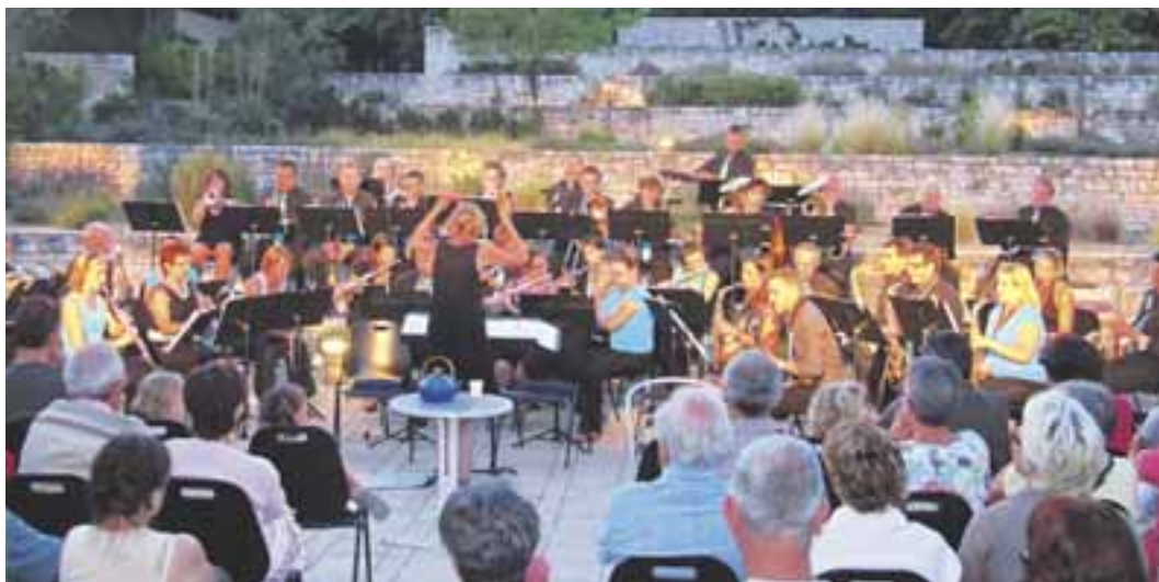
Concert du 9 juillet 2011 - Grand site de l'Aven d'Orgnac.