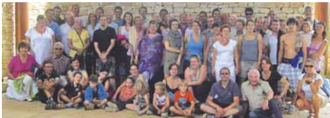
L'équipe Music'All au complet devant la grotte de l'Aven d'Orgnac.

- Samedi 3 septembre : forum des associations à Limonest.