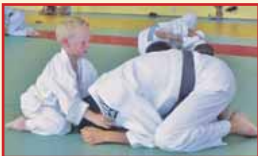
Randoris ludiques entre "générations" : partage des mêmes valeurs et de la même passion...

Contacts : 06 99 16 30 43 ou judoclubsaintdidierlimonest@orange.fr