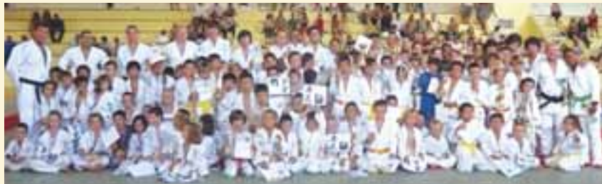
Les judokas du JCSDL réunis en nombre pour leur fête de fin d'année au gymnase du parc des Sports.

d'apprécier tout le travail éducatif et sportif mené par les professeurs. Cette sympathique après-midi s'est terminée dans la convivialité autour d'un goûter.