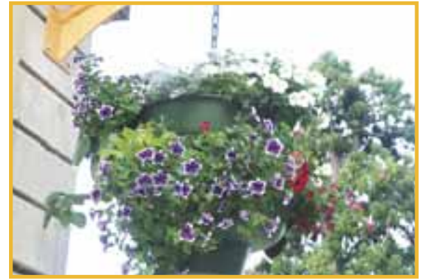
Limonest en fleurs