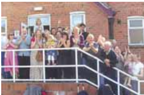
Devant la salle de répétition