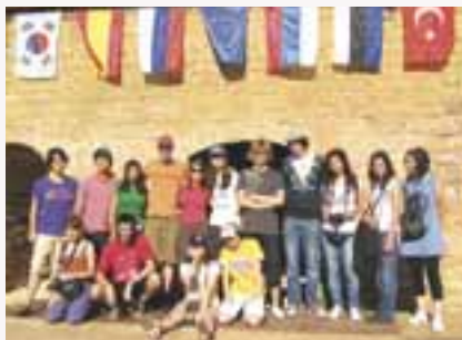
Les jeunes du dernier chantier en 2009

Du 2 au 23 juillet, Limonest va accueillir une douzaine de jeunes venus des quatre coins de la planète pour rénover bénévolement un élément de notre patrimoine. Ce troisième chantier international de jeunesse, organisé par la municipalité, l'encadrement étant confié à Limonest Patrimoine pour restaurer le patrimoine local, permettra de continuer la restauration de la Batterie des Carrières, ancienne fortification située sur la route du Mont Verdun, dans laquelle se dérouleront les festivités du 14 juillet.