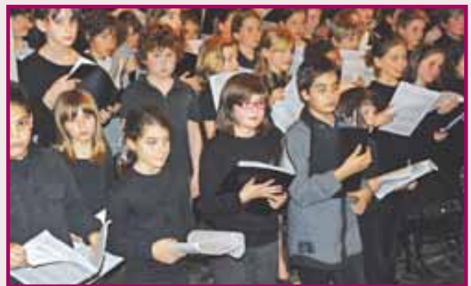
Echange Flint – Michigan USA – mars 2011