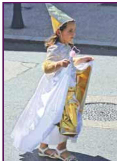
Carnaval des enfants