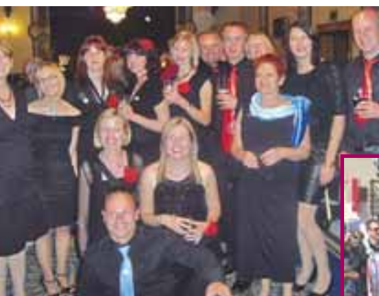
A l'issue de notre second concert au The Earl of Doncaster Hotel