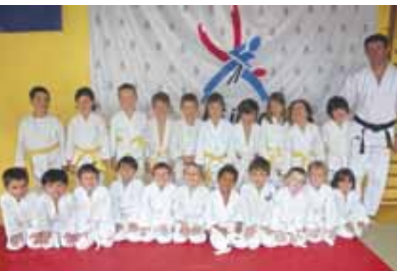
Les enfants de l'école de Judo de Limonest : la relève est assurée...