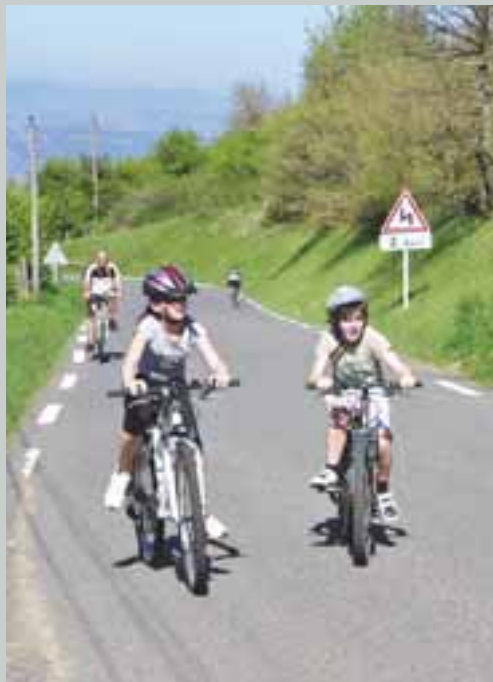
Chronocôte de Limonest