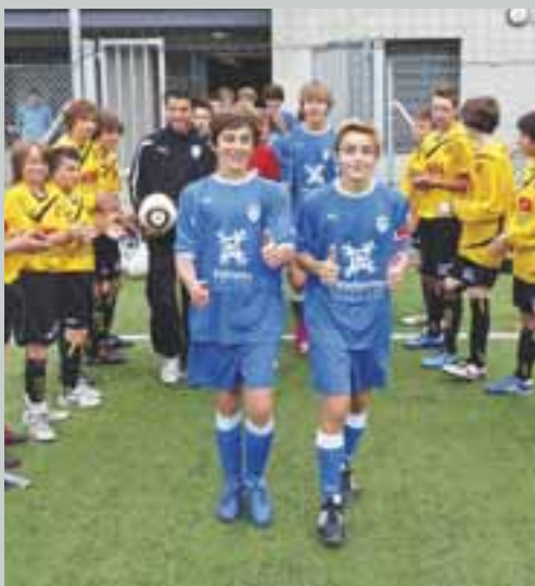
Football Club Limonest - Saint Didier au Mont d'Or